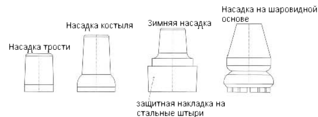
Рис. 1 Виды насадок

Внимание: Зимой следует использовать зимнюю насадку (противогололедную), которую мы выпускаем в универсальном варианте.