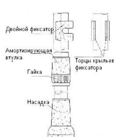
Рис.2 Ступенчатая регулировка